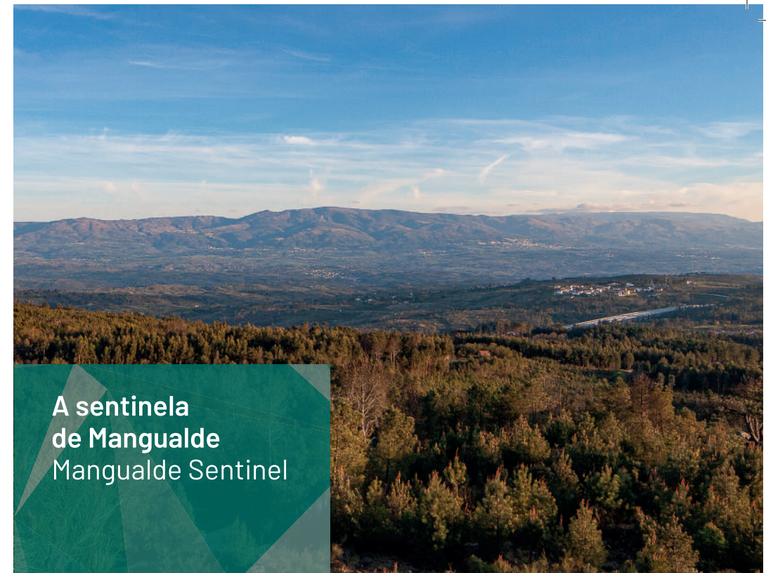
Perspetiva para a Serra da Estrela no Castro do Bom Sucesso / Perspective for Estrela Mountain Range in Bom Sucesso Hillfort

O Monte da Senhora do Bom Sucesso é a sentinela que nos vigia em grande parte do traçado deste percurso. Do alto dos seus 765 m, ponto mais alto do Concelho de Mangualde, avistam-se deslumbrantes paisagens que se estendem por toda a Beira Alta, Beira Baixa, Alto Douro, Trás-os-Montes e até além-fronteira, à espanhola Serra de Gata.